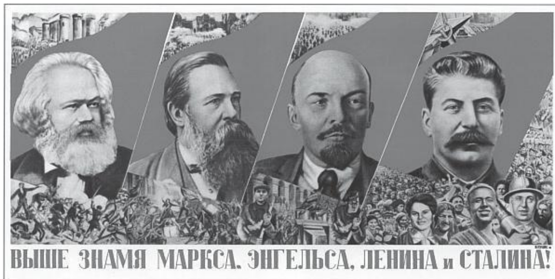
«Выше знамя Маркса, Энгельса, Ленина и Сталина!» Клуцис Г. Плакат. 1936 г.

Реклама, маркетинг и PR работают в альтернативной среде, для которой характерна конкуренция в сфере коммуникаций. Основная особенность пропаганды – безальтернативность. В мягком варианте «пропаганда советует, а PR советуется». В наиболее жестких условиях, характерных для тоталитарных обществ, пропаганда стремится убрать из информационного поля всех «несогласных».