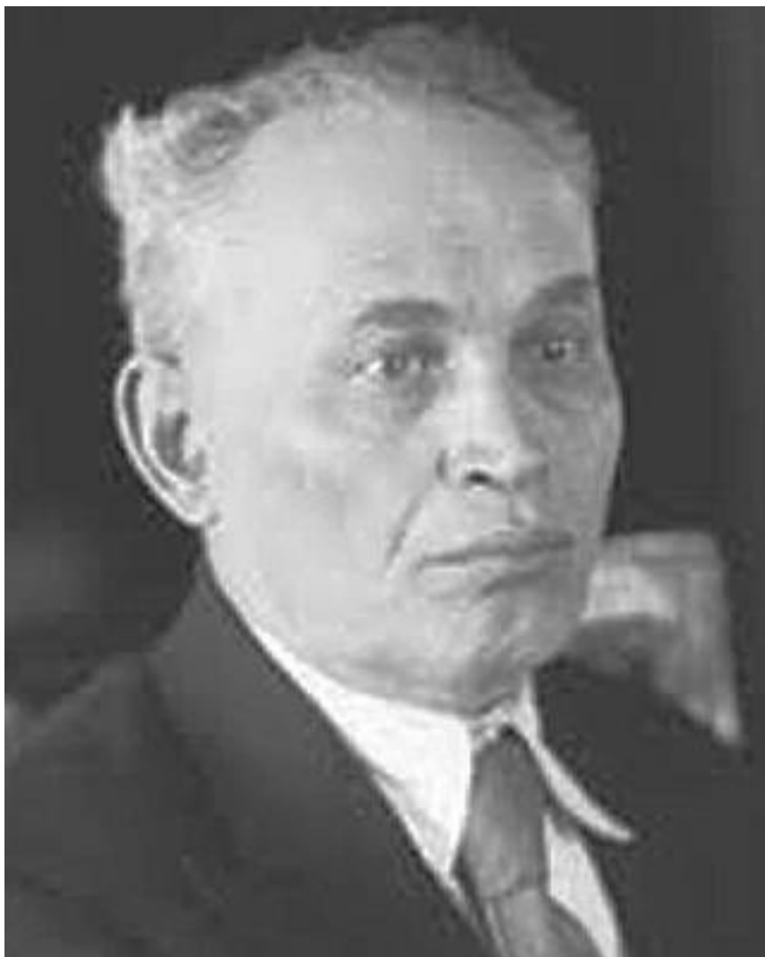
Розенберг Давид Иохелевич, д. э.н., член-корр. АН СССР, Россия 1879–1950 гг.