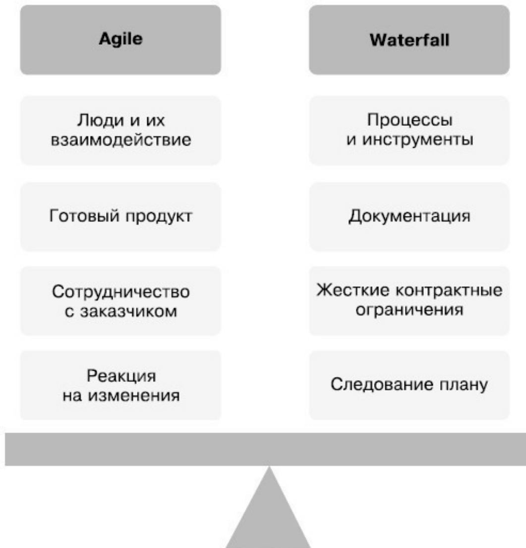
Визуализация ценностей манифеста гибкой разработки

Полный текст манифеста и его переводы доступны на сайте http://agilemanifesto.org . Каждый, кто хочет работать по гибкой методологии, должен ориентироваться на эти четыре «взвешивания»: как только начинает тягелеть не та «чаша весов», надо задуматься: «На верном ли я пути?» Таким образом, манифест станет вашим компасом, по которому можно определять направление движения.