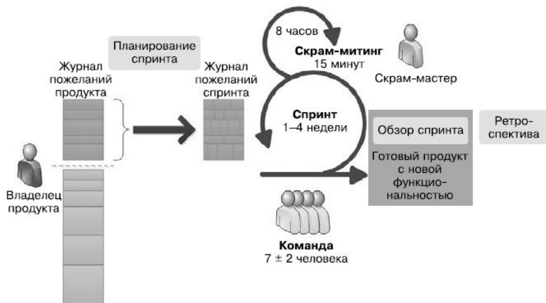
Общая схема Scrum

Организируйте работу в вашей компании в небольших многофункциональных командах , которые содержат всех необходимых специалистов для реализации проекта. Выделите человека – скрам-мастера , который будет отвечать за соблюдение процессов в команде и конструктивную атмосферу.