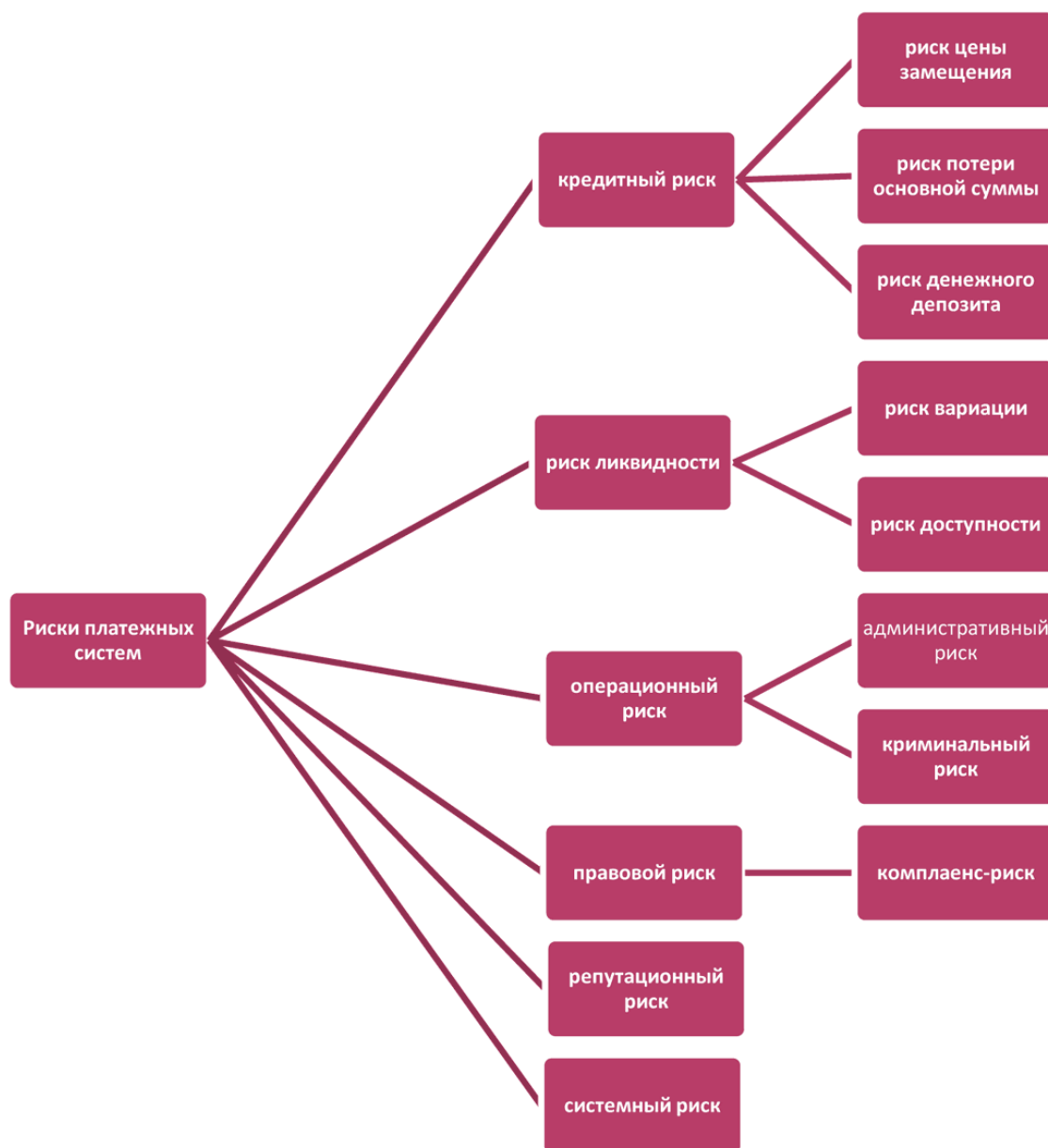
Рис. 1.3.1. Классификация рисков платежных систем.

Системная значимость платежных услуг и наличие широкого спектра рисков, им присущих, предопределяет необходимость их выявления, оценки и минимизации. Ключевую роль в данном процессе, согласно признанному международному опыту, должны играть специализированные государственные органы надзора и наблюдения за платежной системой.