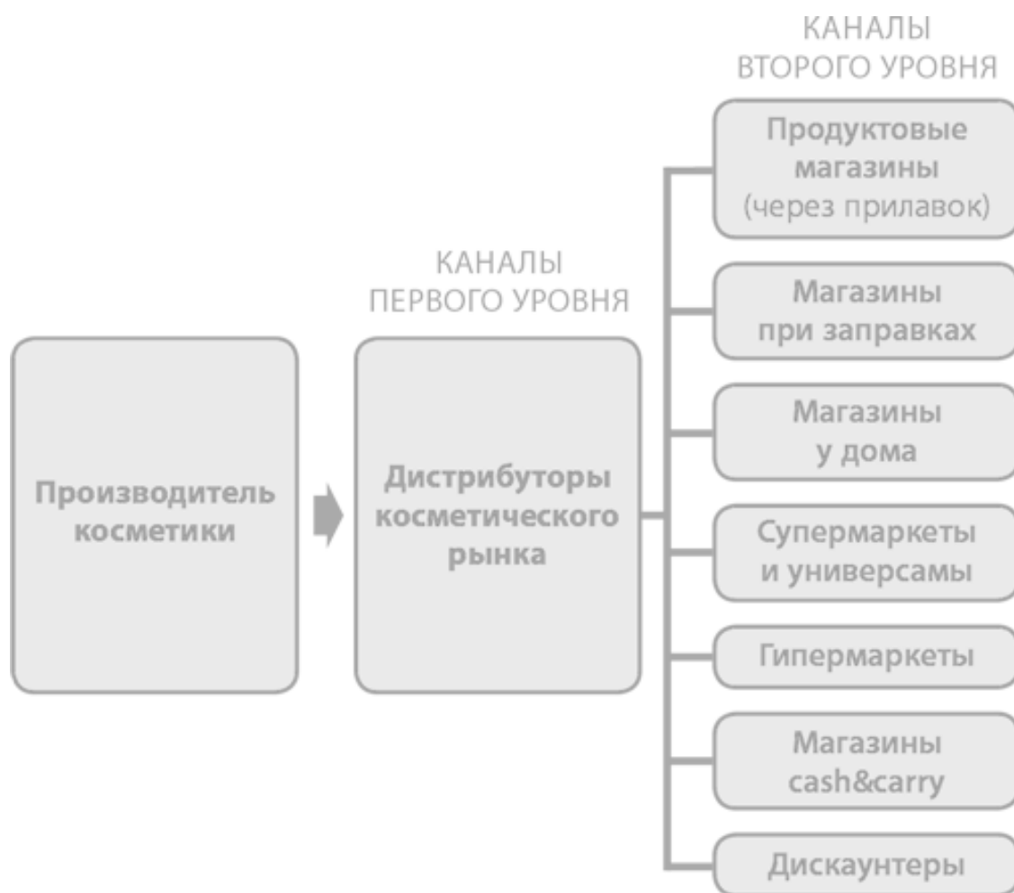
Рис. 1. Каналы дистрибуции производителя косметики

Приведу еще один пример. Рассмотрим каналы, с которыми работает торговый дом – эксклюзивный представитель производителя кондитерских изделий (за основу типологии розничных точек взяты данные исследовательской компании «Бизнес Аналитика»):