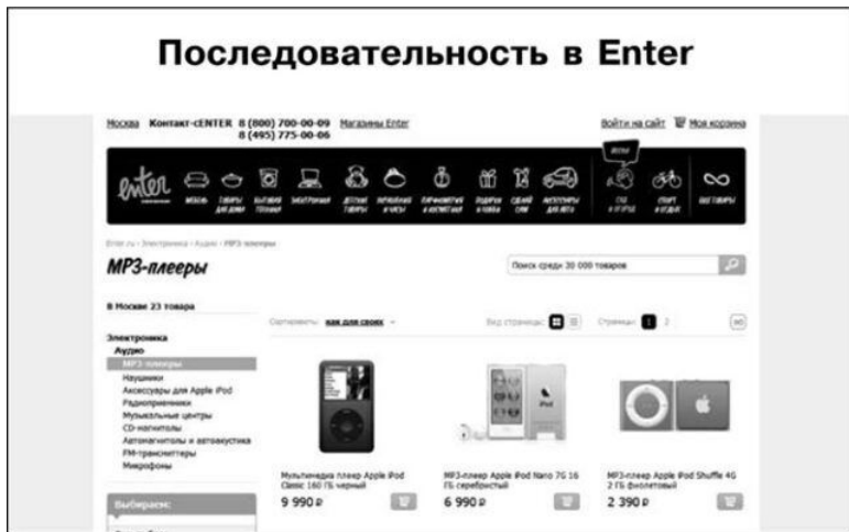
Рис. 1.2. Переход по первому объявлению

iPod Shuffle. К сожалению, нужной нам модели iPod Touch на этой странице нет.