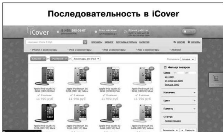
Рис. 1.3. Переход по второму объявлению

не найдя того, что им нужно, или поленившись искать и разбираться в каталоге. Человеку важно сразу видеть именно то, что он ожидает получить.