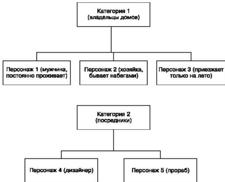
Рис. 1.5. Персонажи для дачных каминов

В нише «покупатели каминов для дачи» можно выделить две основные категории: конечные потребители и посредники (физические и юридические лица, розничные покупатели и оптовики).