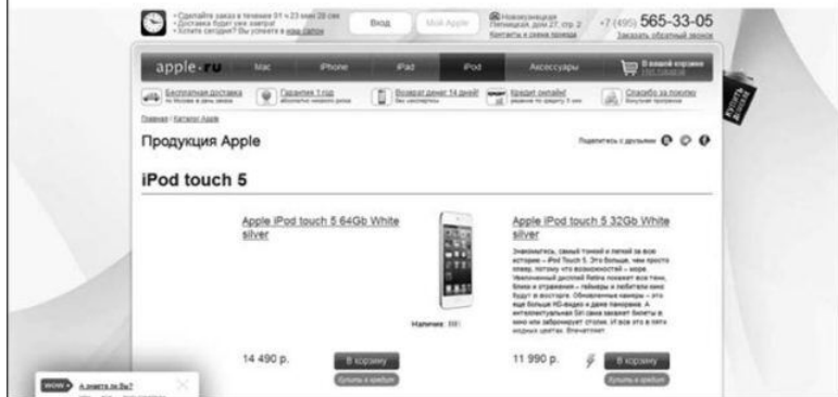
Рис. 1.4. Переход по третьему объявлению

Принцип последовательности полностью соблюден: заголовок, который показывает, куда мы попали, что мы хотели найти, есть крупное изображение iPod touch, надпись «iPod touch 5». Все четко, просто и понятно – использован крупный шрифт и есть конкретное описание искомой модели. Ничего лишнего или рассеивающего внимание пользователя. Именно такая страница будет лучше конвертировать посетителей сайта в реальных клиентов.