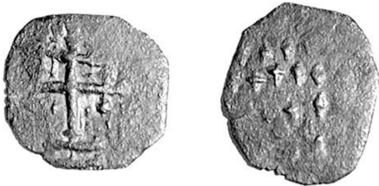
Монета Тмутараканского княжества.

Античные традиции не были забыты. На развалинах древних городов возникали новые поселения. Всякому школьнику известно, какую роль в истории Древнерусского государства сыграл город Корсунь (античный Херсонес). Восточный Крым вошел в состав древнерусского Тмутараканского княжества, города которого были городами погибшего несколькими столетиями ранее Боспорского царства. Столица княжества – Тмутаракань – располагалась на месте боспорского города Гермонассы на Таманском полуострове.