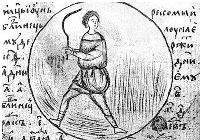
Смерд. Рисунок из средневековой рукописи.

одальные повинности оборачивались разными формами социального протеста зависимых людей вплоть до вооруженных выступлений. Устав Владимира Мономаха, изданный вскоре после восстания 1113 г. в Киеве, вводил ограничения для феодалов, нарушающих экономические права закупов: требование возврата ссуды в повышенном размере, уменьшение земельного надела закупа, использование его труда для собственных хозяйственных нужд.