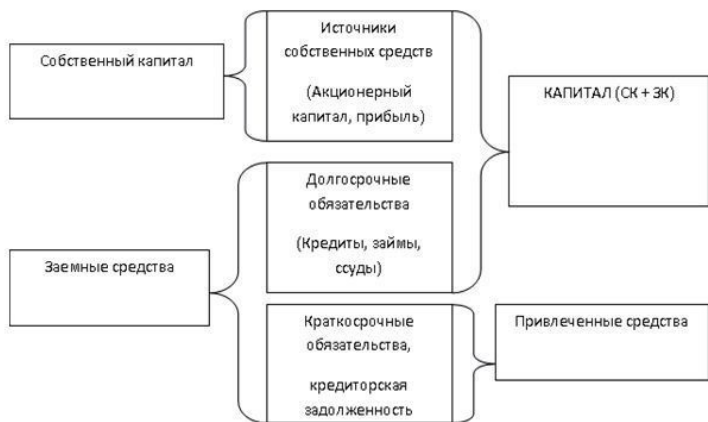
Рис. 1.2. Источники финансирования

Будем исходить из предположения, что оборотные (текущие) активы компании финансируются за счет краткосрочных источников средств (краткосрочных обязательств), а внеоборотные (постоянные) активы – за счет долгосрочных.