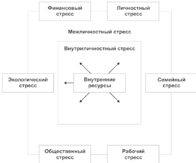
Рис. 1. Области стресса в повседневной жизни

Во внутреннем квадрате обозначена самая суть нашего существования, которую называют «Я сила», «умственная сила», психическая энергия или внутренние ресурсы. Это то, что позволяет индивиду преодолевать кризисы жизни, что определяет интенсивность сопротивления стрессу. Снижение ресурса способствует повышению уязвимости к разным связанным со стрессом расстройствам, таким как тревога, страх, отчаяние, депрессия.