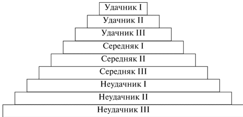
Рис. 2. Уровни благополучия

Неудачники – это такие люди, которые практически никогда не достигают целей, которые сами для себя ставят. А за достижения, даже небольшие, они платят слишком высокую цену. Они отказываются от претензий на результат, успех; часто лишены комфорта на своем жизненном пути. Многие из них упорно думают о том, как они себя поведут во время «генеральной» расплаты за свои неудачи. Когда они накапливают материальные ценности, то делают это ради того самого «черного дня», который, по их мнению, когда-нибудь обязательно наступит. Когда начинают какое-либо дело, то заранее программируют себя на провал и заняты тем, что «подстилают соломку» в те места, куда они обязательно упадут при неотвратимо приближающейся катастрофе. Как видно, такие люди заранее прогнозируют неудачу и своими