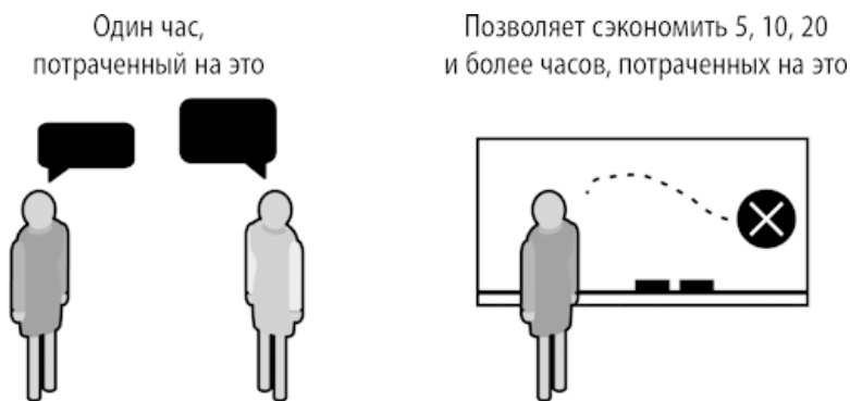
Рис. 1.1. Беседы с потребителями экономят время и деньги

Развитие потребителей начинается со сдвига в сознании. Вместо того чтобы считать свои догадки и предположения безусловно верными и не мешкая переходить к развитию продукта, вы будете изо всех сил стараться найти слабые места и ошибки в своих подходах, проверять обоснованность своих представлений.