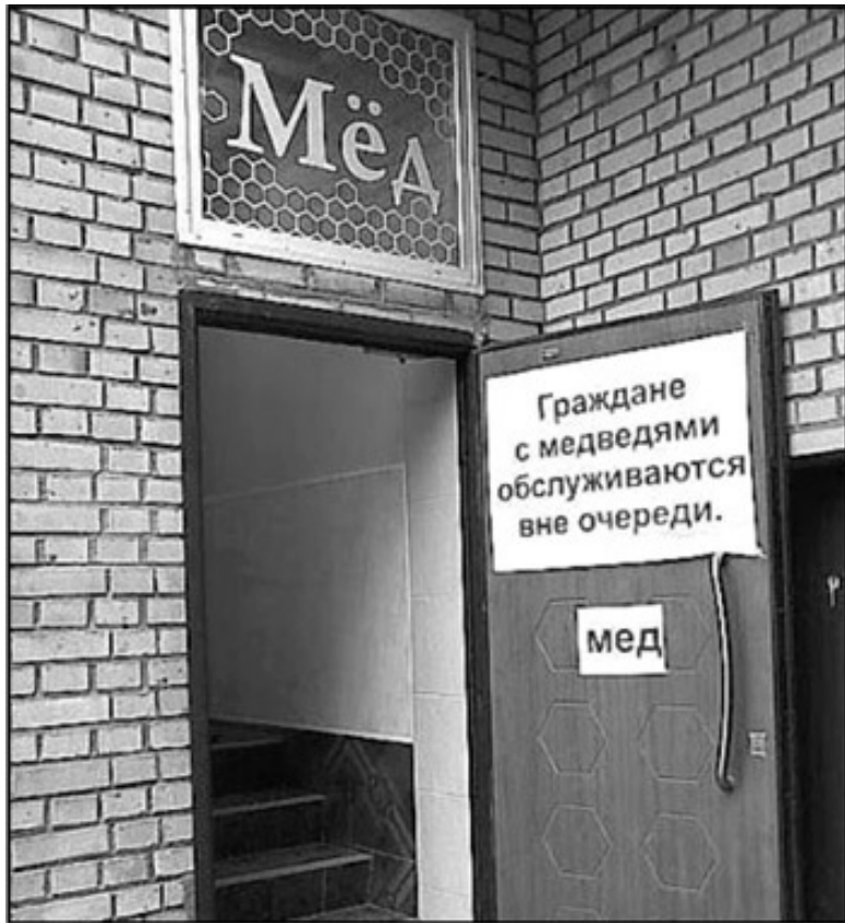
Рис. 2. Михал Иваныч, хватит на балалайке играть, соби- райся в магазин

Реклама противоречила всем правилам. Но у нее было одно преимущество: она задевала