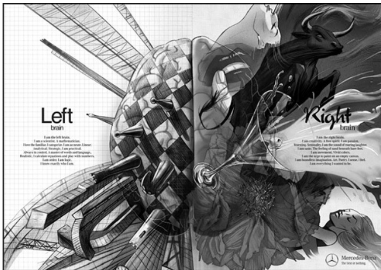
Рис. 1. Рекламный плакат «стреляет» сразу по двум «зайцам»: по левополушарным и правополушарным людям

Объявление дает понять, что рекламируемый автомобиль доставит удовольствие как левой половине нашего мозга, так и правой. Все будет прекрасно как в прагматическом, так и в эмоциональном плане.