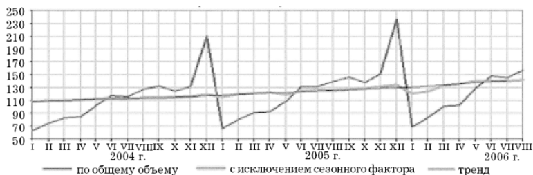
Рис. 2. Динамика инвестиций в основной капитал

Динамика инвестиций в основной капитал в период с 2004 по 2006 г. приведена на рисунке 2.