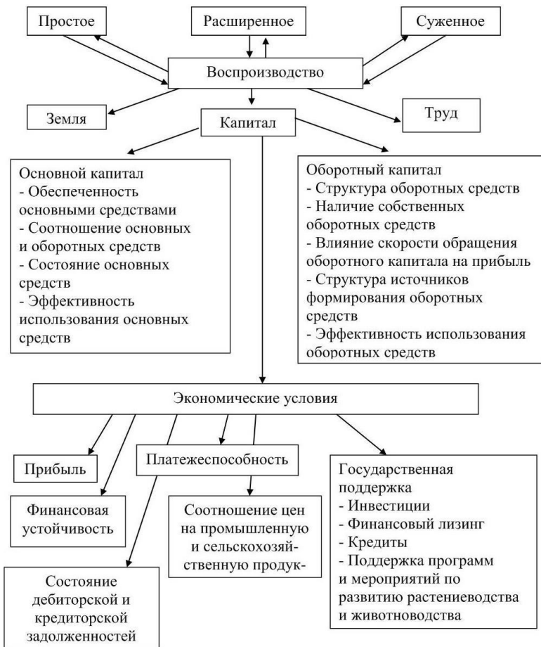
Рисунок 2 – Экономические условия воспроизводства в сельскохозяйственных организациях