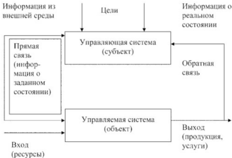
Рис. 1.6. Схема системы управления организации

Очевидно, что именно система управления организации имеет возможность адекватно реагировать на внешние и внутренние воздействия, что придает организации способность к адаптации в изменяющихся условиях, делает ее саморегулируемой.