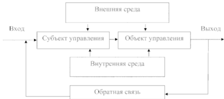
Рис. 1.5. Схема системы с механизмом управления

При этом любая система управления должна иметь четыре основных элемента: