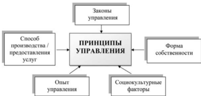
Рис. 1.3. Механизм формирования принципов управления

Механизм формирования принципов управления представлен на рис. 1.3.