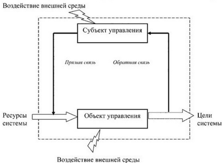
Рис. 1.2. Система управления организации в виде контура управления