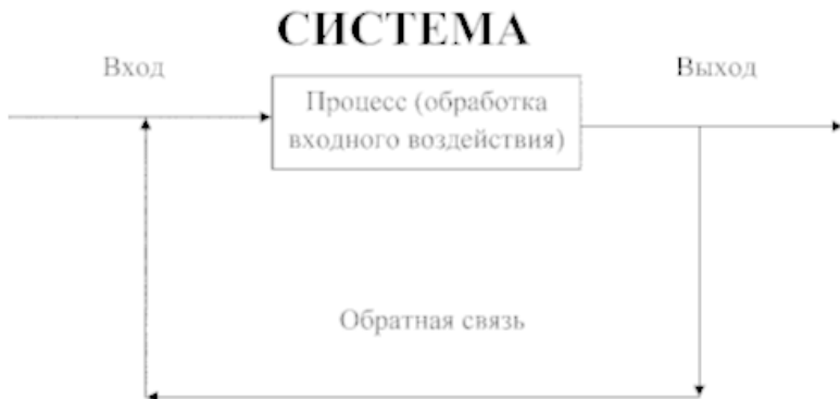
Рис. 1.4. Схема функционирования системы

Управление – это процесс воздействия на систему с целью поддержания заданного состояния или перевода ее в новое состояние. Система управления это: