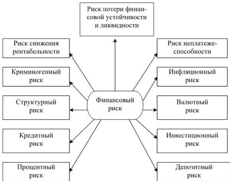
Рис. 1.2. Основные виды финансового риска

Снижение риска осуществляется при помощи механизмов нейтрализации (рис. 1.3).