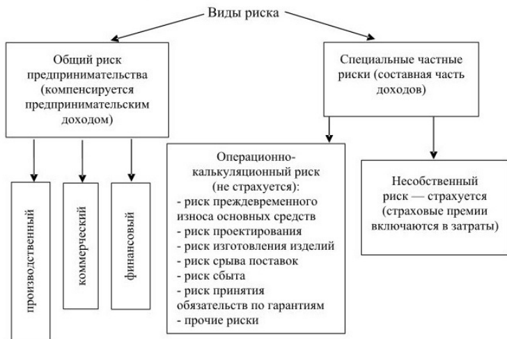
Рис. 1.1. Классификация рисков

Особенно важен в предпринимательской деятельности учет финансового риска (рис. 1.2).