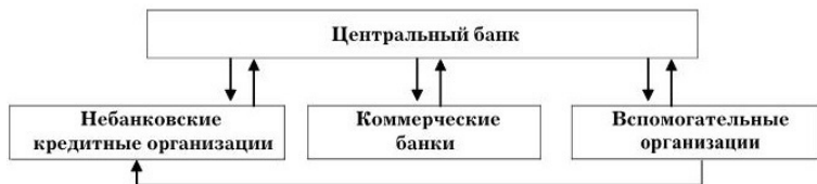
Схема 1.1. Структура банковской системы

Сказанное схематически можно представить следующим образом.