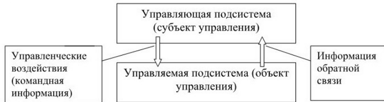
Рисунок 1.2. Структура управленческого процесса.

В литературных источниках существуют различные взгляды на структуру процесса управления. Керимов В.Э. выделяет 4 стадии процесса управления (51, с.20):