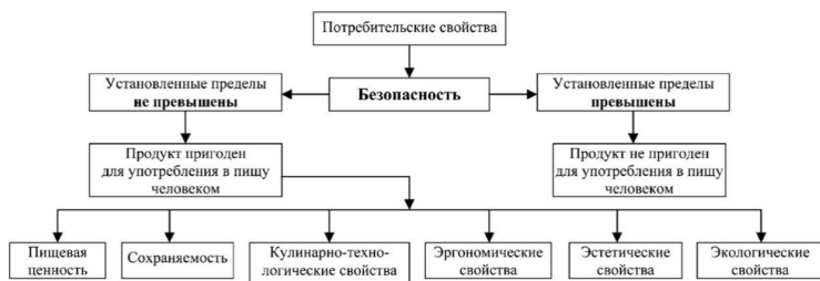
Рис. 1.1. Структура потребительских свойств продовольственных товаров

Структура потребительских свойств продовольственных товаров схематично представлена на рис. 1.1.