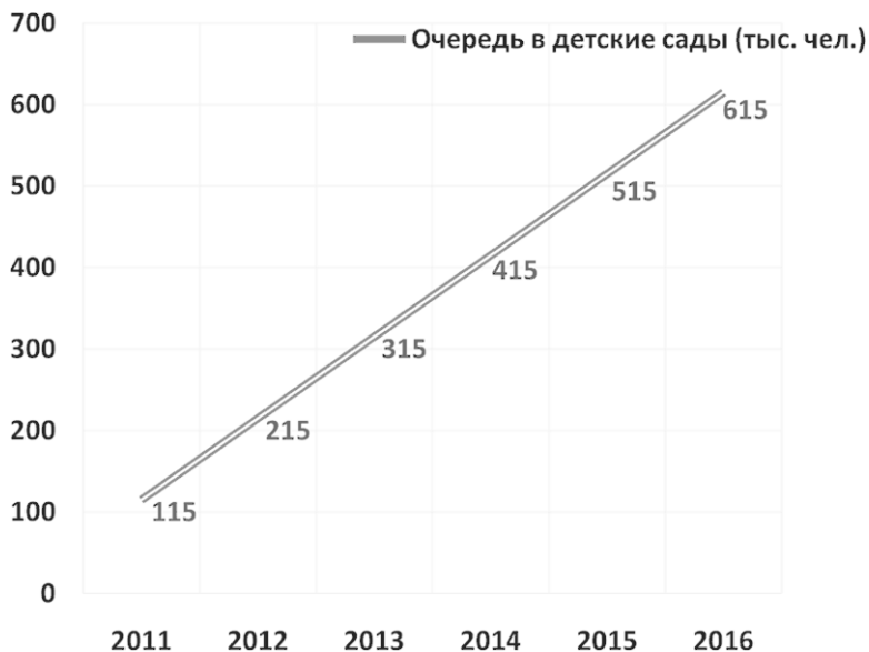
Рис. 3. Динамика роста очередей до 2016 г.

области 115 тыс. детей находились в очереди в детсады, в 2013 г. их число достигло 215 тыс. К 2016 г. очередь в детские сады не будет ликвидирована. На рис. 3 можем увидеть динамику роста очередей до 2016 г.