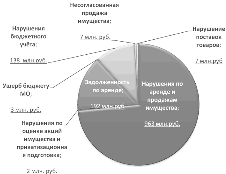
Рис. 1. Нарушения Минимущества за 2011–2013 гг.