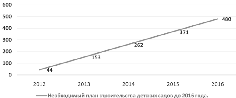
Рис. 5. Необходимый план строительства детских садов до 2016 г.