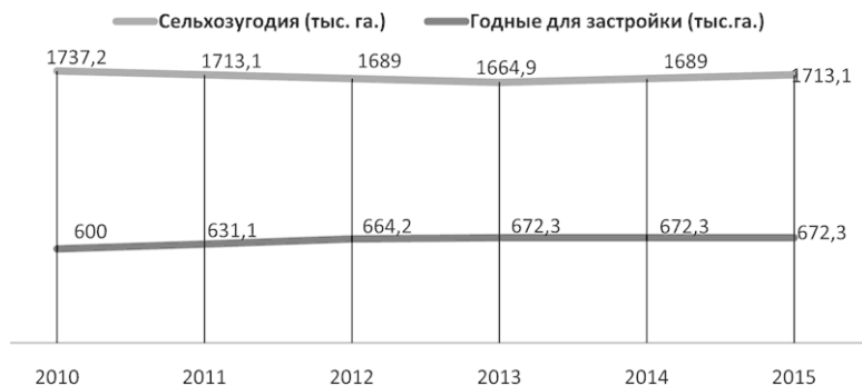
Рис. 4. Динамика сокращения сельхозземель до 2015 г.

Огромные очереди в детские сады – результат невыполнения планов по строительству детских садов, неумение государственных органов предвидеть рост населения. Поэтому следует увеличить строительство детских садов (рис. 5).