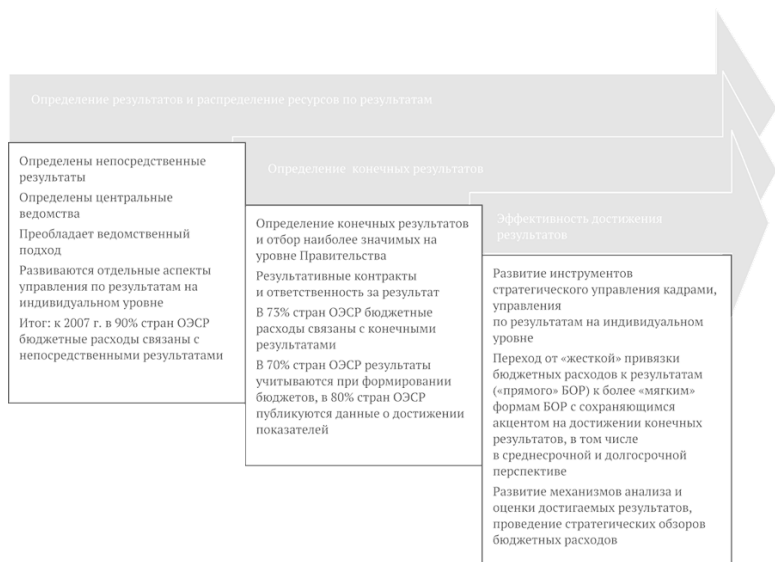
Рис. 1.1. Этапы внедрения управления по результатам в зарубежной практике

(статс-секретарями), внедрение механизмов оплаты труда по результатам, инструменты мониторинга и оценки качества государственных услуг. На данном этапе также проявились такие характеристики, как селективный отбор наиболее значимых показателей эффективности и результативности (например, в Великобритании канцелярия премьер-министра отбирала 30–40 наиболее значимых показателей для постоянного мониторинга среди более 100 целевых национальных показателей).