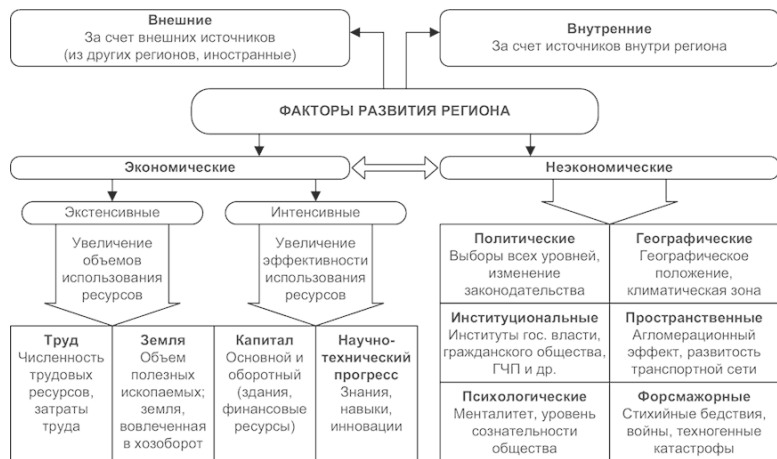
Рисунок 1. Классификация факторов развития региона.

В общем виде факторы, оказывающие влияние на развитие региона, можно классифицировать на экономические и неэкономические (рис. 1). Источники данных факторов могут быть внутренними и внешними.