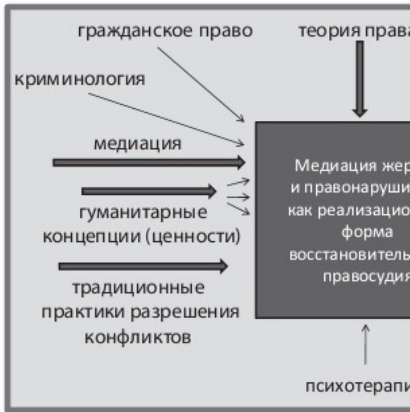
Рис. 2. Источники и содержательные аспекты программ восстановительного правосудия