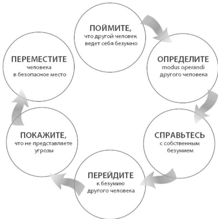
Рис. 1.1. Цикл благоразумия

Вот что вам нужно делать на каждом этапе этого цикла.