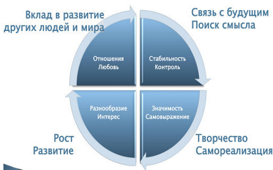
рис. 2 Личностные и Духовные потребности. Связь между ними.

Ответьте искренно, было ли когда-либо, что вы создали что-нибудь, и потом сказали: «Да, это похоже на меня!»