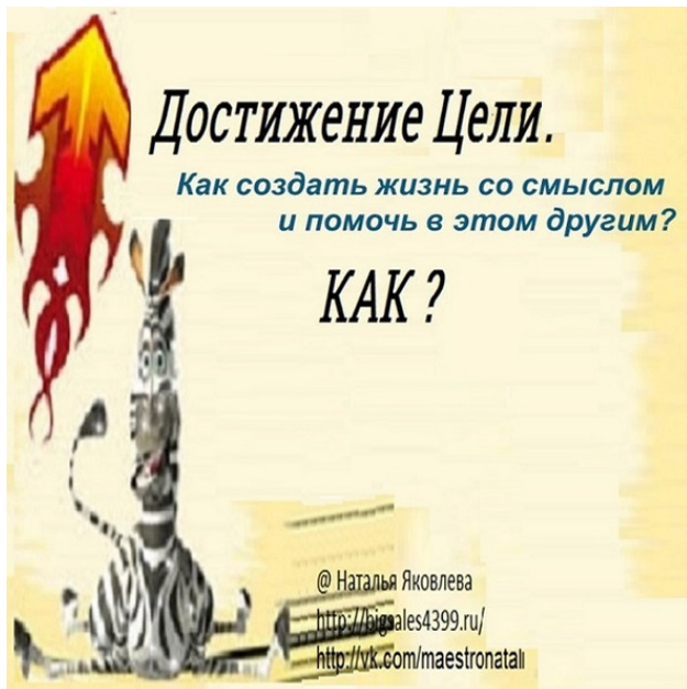
рис.1 Достижение Цели. КАК?

Сейчас я тоже похожа на жирафа, которого вы видите на обложке моей мини-книги. Рядом взлетает ракета, которая попадет точно в цель. У меня же большие глаза, удивленно задающие вопрос: «Как же достигнуть цели?». Не от того, что что-то не сложилось в жизни.