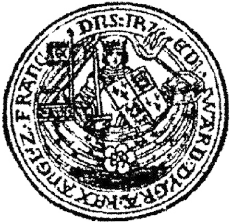
Рис 3. Нобль короля Эдуарда