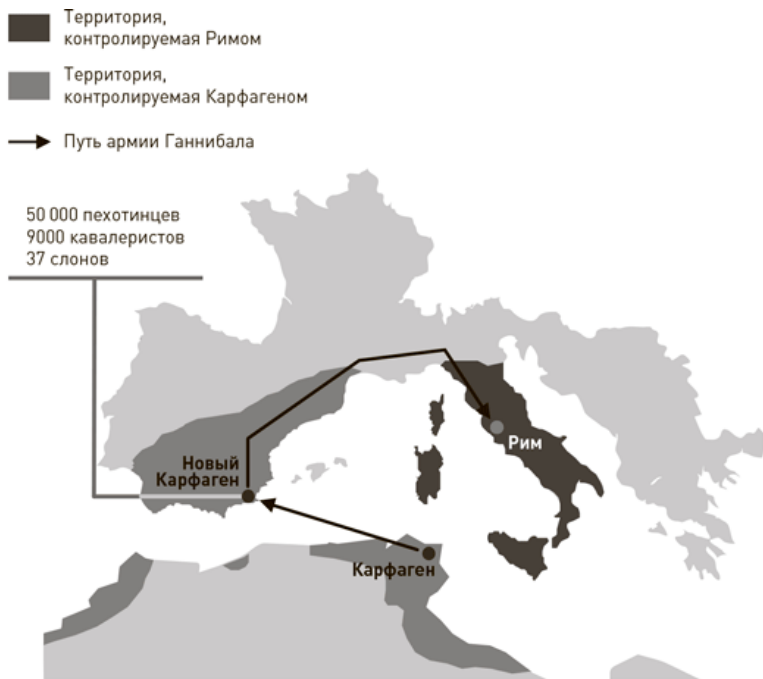
Рис. 4. Стратегическое решение Ганнибала: маршрут в Рим

Учитывая полководческий талант Ганнибала, который он продемонстрировал при разработке стратегии, возникает естественный вопрос: почему же все-таки через 17 лет он проиграл Вторую Пуническую войну? Один из ответов, предлагаемых историками, таков: ему не удалось беспрепятственно продвинуться ближе к Риму, закрепив позиции, завоеванные в результате первых побед. Вместо этого он ввя-