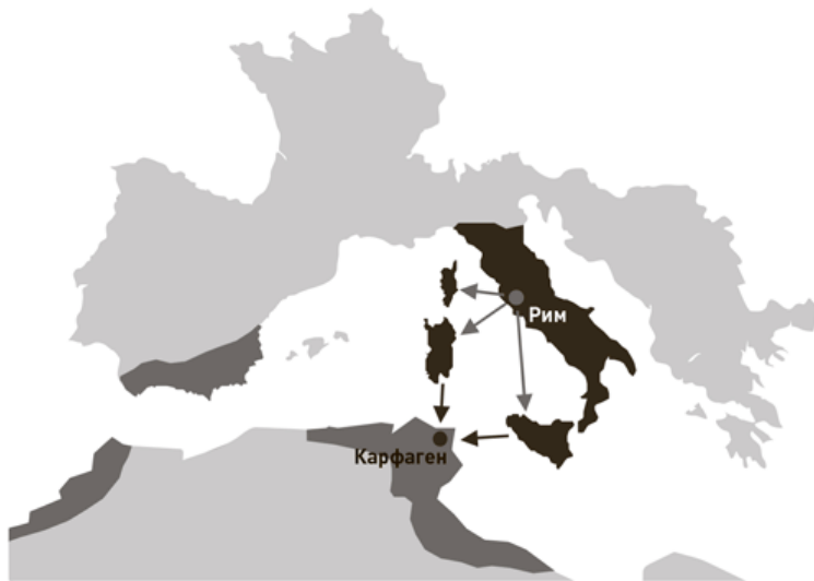
Рис. 2. Положение дел после Первой Пунической войны

Карфаген осознавал угрозу, и одному из военачальников, Ганнибалу, было поручено разработать стратегию предстоя-