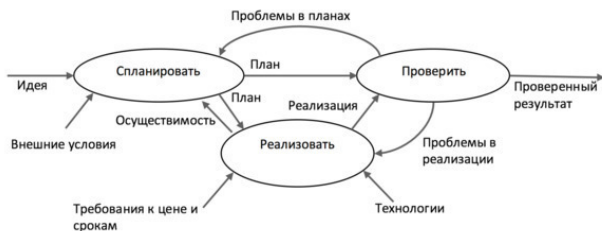
Рис. 1. Обобщенная схема инженерной деятельности как цикл Шухарта-Деминга

Под инженерией я, в свою очередь, буду понимать в этой книге любое спланированное изменение окружающего мира, результат которого может быть проверен на соответствие задуманному плану. Поскольку эмпирический научный метод Бэкона время от времени переживает очередную реинкарнацию, например в цикле Шухарта-Деминга (рис. 1), то мне ничего не остается, как сослаться на Бэкона и его предшественников (античных и, возможно, более ранних), пытающихся формализовать здравый смысл или, как чаще говорили в те времена, Божественный замысел. В итоге получим, что инженерия – это эмпирический научный подход к прикладным задачам. Теперь, внимание. Поскольку инженерия, сама по себе, тоже является прикладной задачей, то можно себе представить эмпирический научный подход к инженерии. Это и есть системная инженерия.