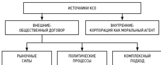
Рис. 1. Основные трактовки источников КСО

обязанности. Можно выделить три группы исследований, соотносящих это внешнее воздействие с рыночными силами, с политическими процессами, а также придерживающихся комплексного подхода (рис. 1).