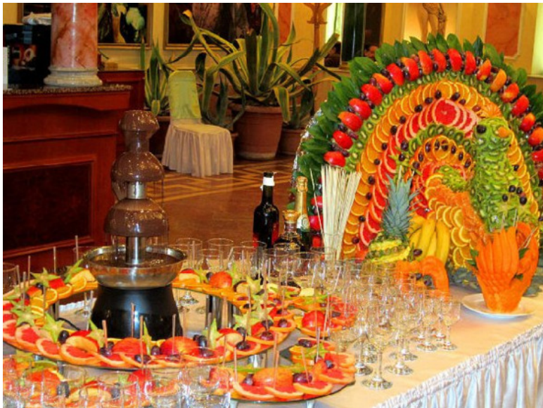
Фото из источника в списке литературы [3]

Если говорить о порционных блюдах, то их использование для фуршетов не предусматривается. На фуршетах практикуется подавать отличающиеся миниатюрностью различные закуски, раскладываемые на общих больших размеров блюдах. Каждым из гостей самостоятельно делается выбор закусок (согласно собственным предпочтениям), которые «собираются» в тарелку.