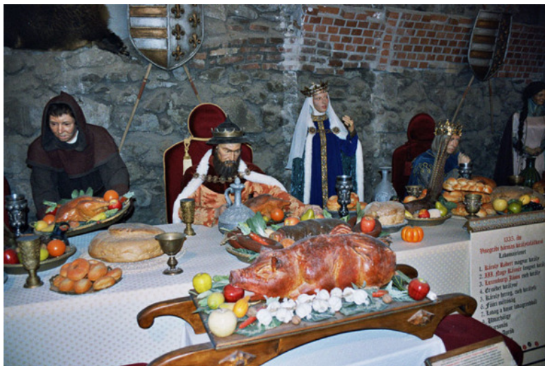
Фото из списка литературы [7]

Люди заботились об оформлении своего социального статуса, немалая роль в этом отводилась гастрономическому