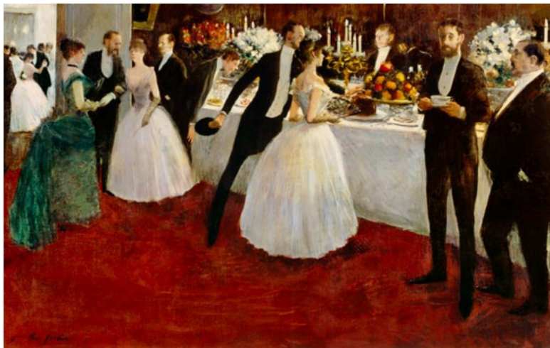
Фото из источника в списке литературы [1]

Своими корнями фуршет уходит в одну из шведских традиций распивания швеппса, представляющего собой алкогольный напиток. Шведские мужчины, когда собирались для обсуждения дел за столом, пили из общей на всех бутылки и разговаривали. Позднее произошла трансформация этой