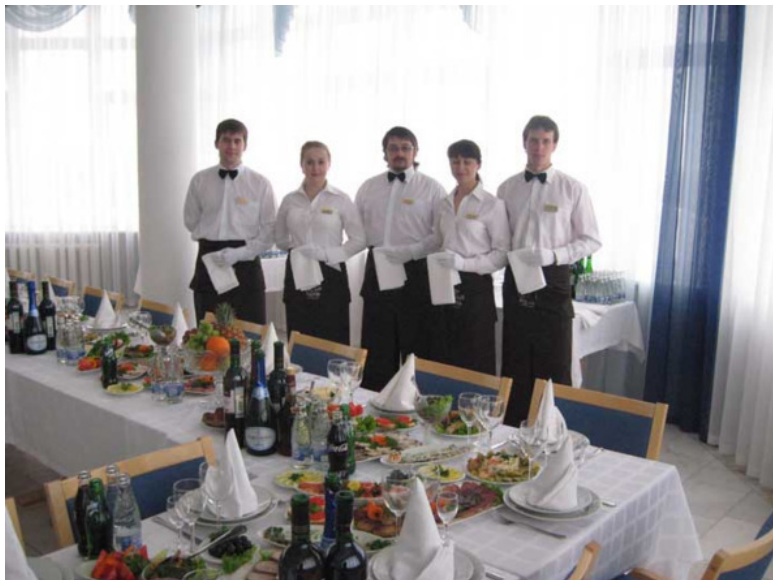
Фото из источника в списке литературы [5]

Вкусовые качества блюд на фуршете должны быть, конеч-