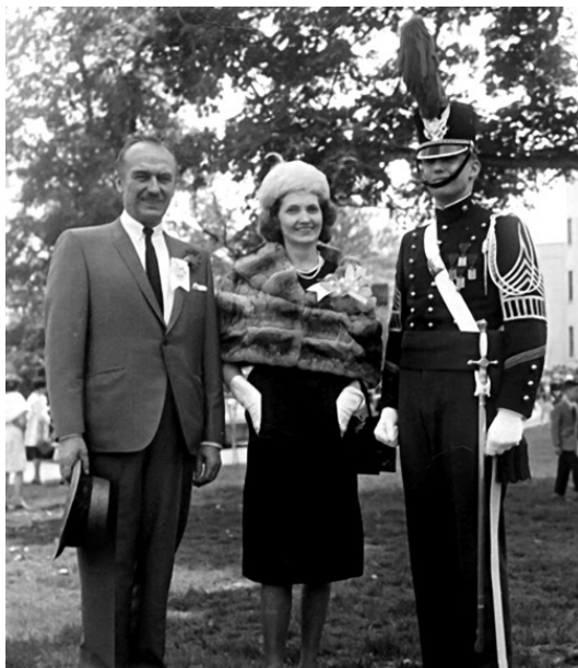
Дональд Трамп со своими родителями – Фредом и Мэри

Юноша считал, что, имея профессию строителя, всегда сможет заработать на жизнь. Свое первое «здание» он построил, когда ему едва исполнилось 16 лет, это был каркасный гараж на две машины для соседа. В ту пору представители среднего класса только начинали обзаводиться личными автомобилями, поэтому Фред с большим успехом влился в этот новый вид строительного бизнеса, начав ставить соседям сборные гаражи за 50 долларов каждый.