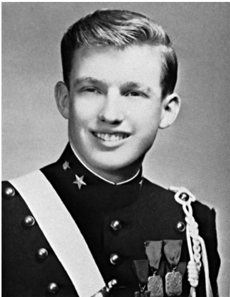
Дональд Трамп в форме Военной академии