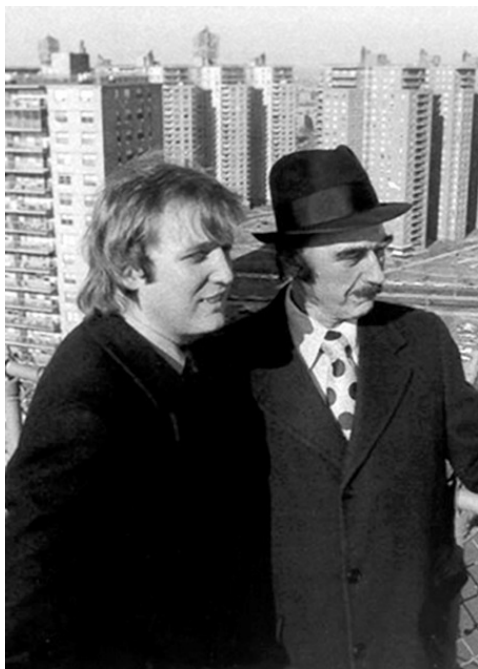
Строительные магнаты: Дональд и Фред Трампы

нальда общаться с профсоюзами и политиками, чтобы строить, не превышая смету и опережая проектные сроки. А уж потом, после завершения строительства, когда оказывалось, что очередное здание завоевало заслуженный успех, окружающим казалось, что это грандиозный промоушен. На самом же деле обретенный успех был продуктом хорошо выполненной работы.