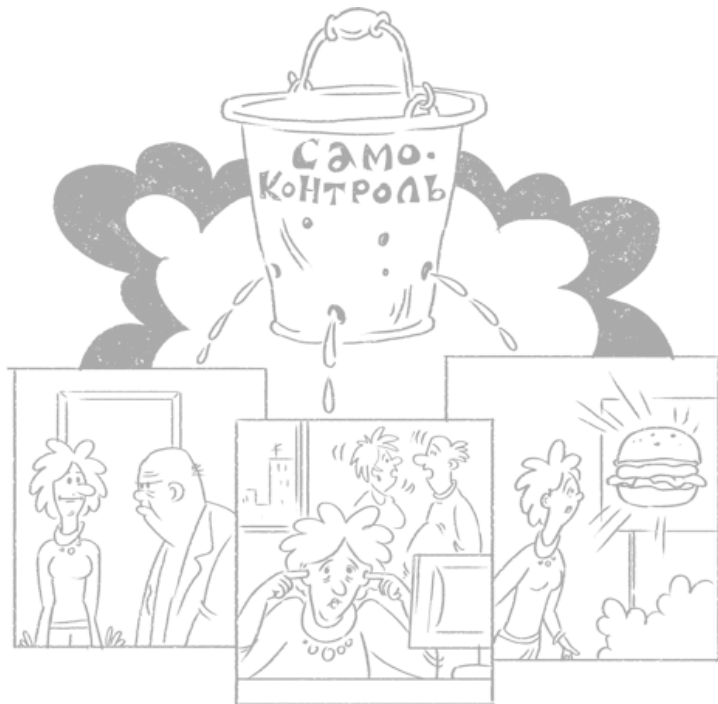
Рис. 2.2 Ситуации, которые требуют от нас сдерживать свои порывы, эмоционально насыщенные моменты и стресс истощают способность проявлять силу воли

Добровольцы, истощенные заданием не думать о белом медведе, хуже справлялись с упражнениями, которые требовали внимания и усидчивости. Точно такой же эффект обнаружился, когда испытуемых заставили подавлять убеждение, что некий скинхед по имени Хайн – плохой человек. Разумеется, ученые выдумали Хайна специально для экспери-