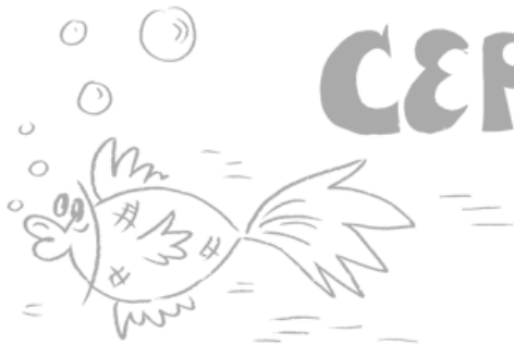
Рис. 2.1. Попробуйте быстро сказать, какого цвета первое, второе и третье слово. Рыба на картинке символизирует, что не выдать себя в этом тесте в состоянии только немой

Участники эксперимента, вынужденные наблюдать страдания живых существ и сдерживать естественные при этом эмоции, справлялись с тестом Струпа даже хуже русских шпионов. По версии Баумейстера, это вполне естественно: предыдущее задание настолько истощило их запас самоконтроля, что никакой возможности долго удерживать внимание на разноцветных буквах у них не осталось. В дру-