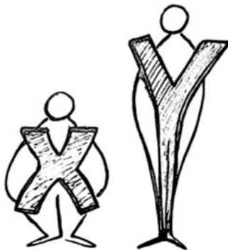
Рис. 3. «ИксИгрек»

«ИксИгрек» работает на рынках b2b и b2c, у компании – офис в Москве и три региональных филиала.