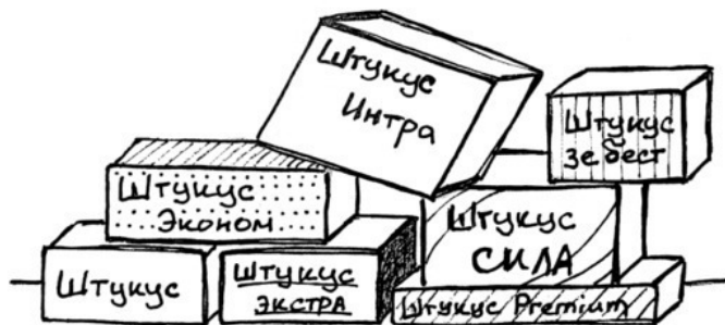
Рис. 4. «Штукус»

«Штукус» как продукт представляет собой довольно странного кентавра: продукт экономкачества по экономичности дополнен wow-сервисом и сложным интернет-порталом. «Штукус» усиленно рекламируют в местах продаж (что логично), и у PR-отдела «ИксИгрек» есть инструкция продвигать компанию в luxury-сегменте (что странно).