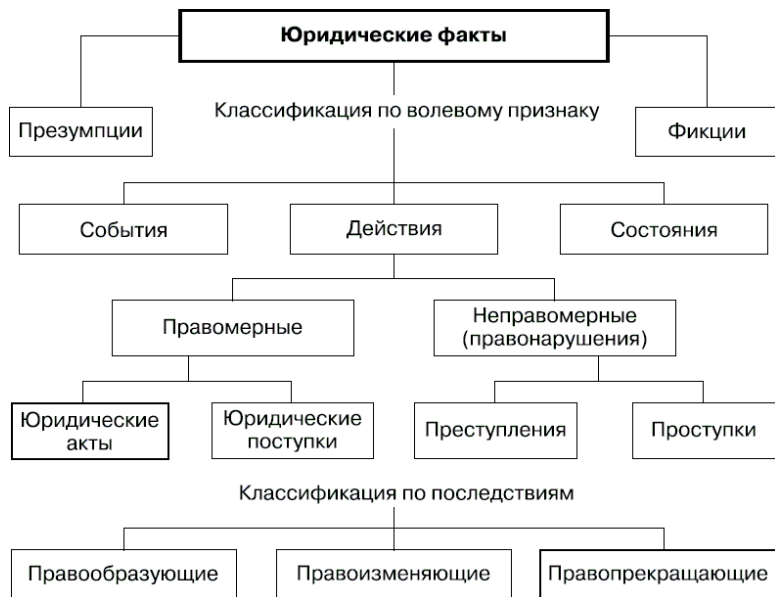
Рис. 1.2. Классификация юридических фактов

В теории права существуют две основные классификации юридических фактов (рис. 1.2): по волевому признаку и по последствиям.