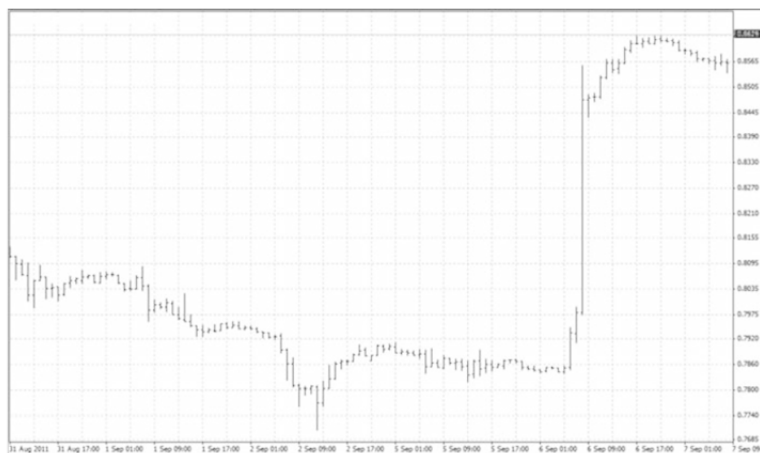
Рис. 1.1. Интервенция Национального банка Швейцарии на рынке CHF

Шестого сентября 2011 г. USD подорожал более чем на 500 пипсов всего за один час. Это означает для пары USDCHF движение в $5000 при стандартной сделке с размером лота 100 000 единиц.