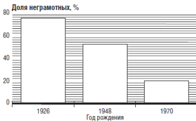
Рисунок 4. Распространение грамотности в развивающихся странах