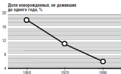
Рисунок 2. Снижение уровня младенческой смертности