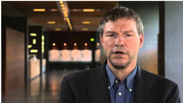
Ник Сабо (Nick Szabo)

Поиски мифической личности – создателя первой массовой криптовалюты, – безусловно, будут продолжаться и далее. И не только потому, что всем интересно узнать истинное лицо создателя революционной технологии, которая изменяет мир.