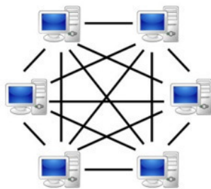
Одноранговая (P2P) сеть

Таким образом, регистр Биткоина, он же блокчейн, одновременно хранится в одноранговой сети на тысячах компьютерах (серверах) во всем мире – от США до Японии