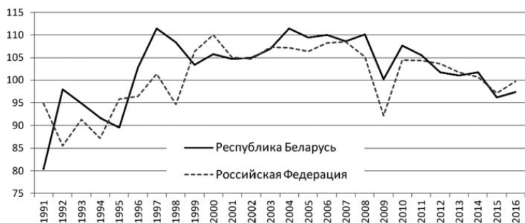
Рис. 1.1. Динамика ВВП (в постоянных ценах), в % к предыдущему году

шли жесткие монетаристы, не желавшие поддерживать производство. И она падает везде, где у власти остались те, кто больше всего говорит о поддержке производства, о льготных условиях для предприятий. В пример он привел успешно развивающуюся Албанию и кризисную Беларусь, которая «в полной мере развалила свою экономику» [2, с. 4–5]. Между тем именно с этого года начался успешный рост белорусской экономики, который превзошел успехи либеральных монетаристов в Российской Федерации. Хотя Беларусь относительно бедна полезными ископаемыми, взвешенная экономическая политика позволила нашей стране уже с 1996 г. выйти на положительные темпы роста ВВП и поддерживать их достаточно долго на более высоком уровне, чем Россия (рис. 1.1).