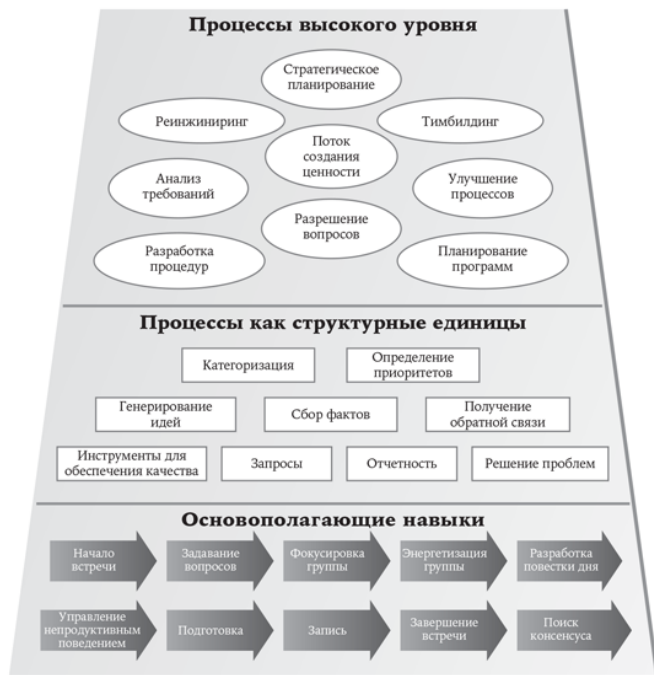
РИС. I.2. ОБЛАСТИ ОСНОВНЫХ НАВЫКОВ ФАСИЛИТОРА

ВЫЮ, мы выявили ряд навыков, которые считаем основными для любого фасилитатора (рис. I.2).