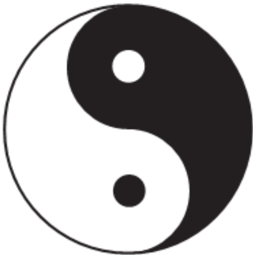
Рис. 2. Символ реинкарнации

В этом древнем восточном символе зашифрована тайна реинкарнации. Черная половина – это тот отрезок цикла развития, который мы проводим в физической оболочке, а белая половина – это период вознесения души, ее бестелесного бытия. Вместе они образуют полный цикл духовного роста. Символ имеет форму круга, что означает, что этот процесс никогда не заканчивается: один цикл переходит в другой. Мы никогда не останавливаемся в своем росте и развитии