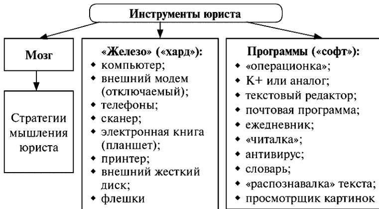
Схема 1. Инструменты юриста

Юрист начинается с мозга. Это и есть азы азов, начало начал. Компьютеры, правовые системы и прочие «костыли» – вторичны. Первично – как ДУМАЕТ юрист.