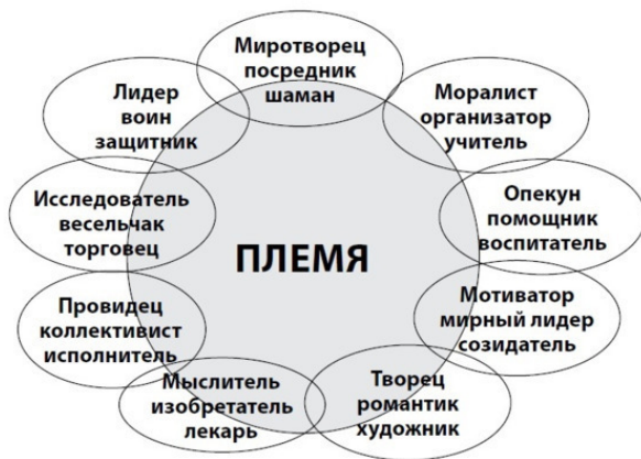
Рис. 2. Структура первичных социальных групп

с лидерскими качествами, у племени, полностью состоящего из людей, лишенных лидерских качеств, или у племени, в котором есть и лидеры, и исполнители? Конечно, первые два племени были бы обречены на исчезновение, они просто не смогли бы эффективно взаимодействовать. В каждом племени, как минимум, должны быть люди: