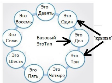
Рис. 4. Базовый тип и крылья

активные и позитивные. Но базовые проявления характера, а также переходы в стресс и позитив похожие.