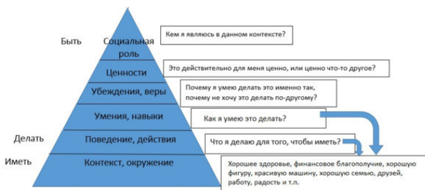
Рис. 3. Факторы, определяющие уровень «Умения и навыки»

Чтобы научиться определять типы характеров других людей, потребуется некоторое время. Определять ведущий инстинкт вы сможете сразу после того, как дочитаете эту главу.