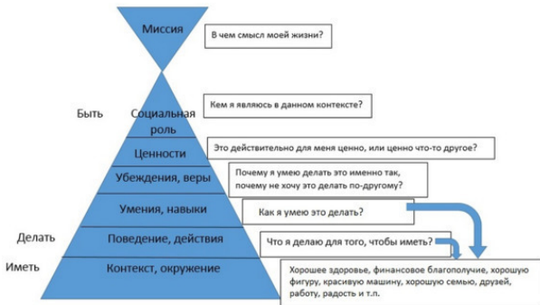
Рис. 1. Пирамида логических уровней

Главный закон пирамиды логических уровней – невозможно измениться на уровне поведения . То есть бесполезно делать то же самое, но надеяться на другой результат. Если у меня что-то не получается, значит, я неправильно это делаю. Мне нужно найти подходящий навык и вести себя по-другому. Если я не хочу учиться чему-то новому, значит, мне необходимо разобраться со своими убеждениями и ценностями. А также понять, что в каждом контексте мы проявляем себя во множестве социальных ролей (например, мужчина в семье может быть: муж, отец, друг, любовник, добытчик, защитник и пр.).