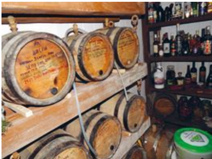
Погребок. Бочки на частной пивоварне