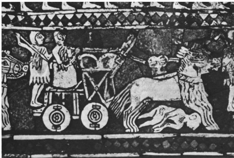
Рис. 2.4. Шумерская боевая повозка. Мозаика из царских гробниц г. Ур. Около 2500 г. до н. э.

В китайских монетах императора Ши Хуанди III века до н. э. [6] были квадратные отверстия. Отверстия в монетах некоторых стран сохранились до сих пор, например, в норвежских и датских кронах и в монгольских мэнге. А само название «деньги» созвучно монетам теньге, которые появились в древности и до сих пор используются в Казахстане. Отверстия защищали деньги от подделок, а также через них можно было нанизывать деньги на шнурок и надежнее их сохранять.