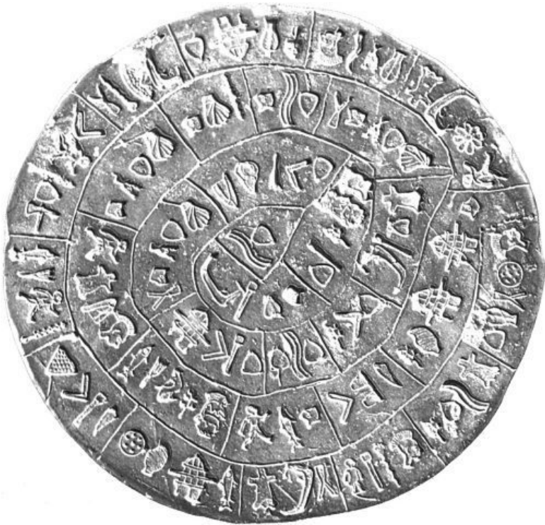
Рис. 2.2. Фестский диск минойской цивилизации. II тыс. до н. э.

Одно из первых изображений колеса можно увидеть на Шумерской пиктограмме IV тыс. до н. э. (рис. 2.3). На мозаике из гробницы города Ур середины III тыс. до н. э. уже ви-