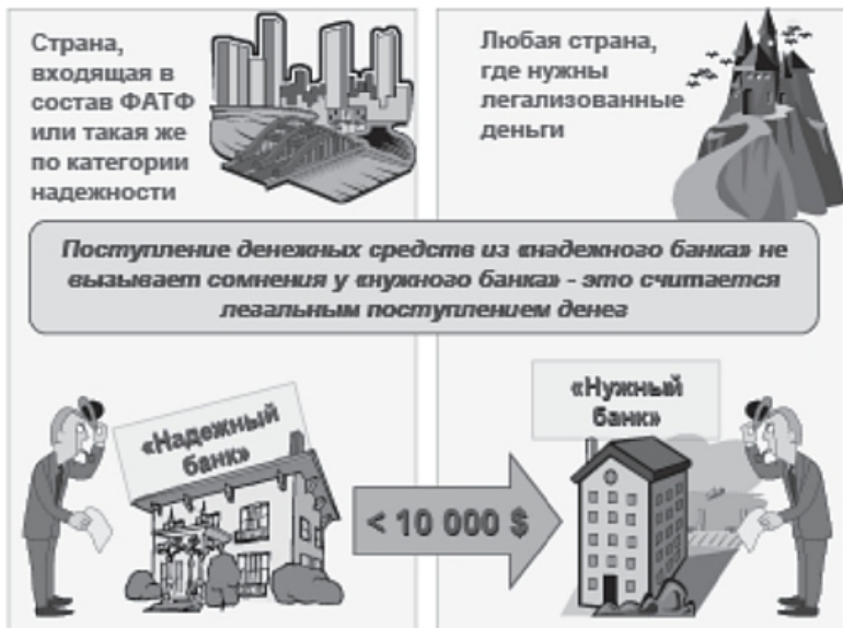
Рис. 3. Использование надежных банков в схемах, направленных на ОД

Проблема ОД имеет прямое отношение к финансированию терроризма.