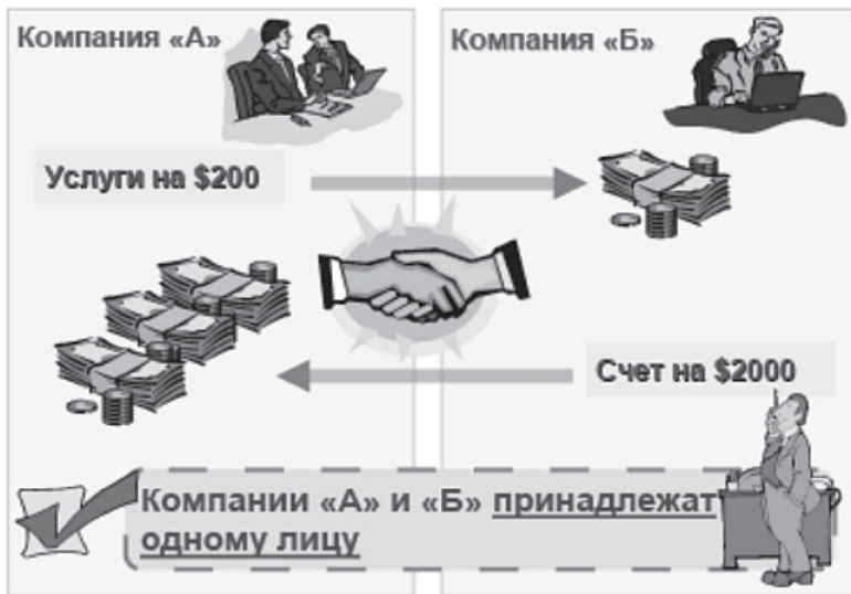
Рис. 6. Сделка, направленная на отмыwanie денег посредством оплаты услуг по чрезмерно завышенным тарифам

Аналогичный результат был достигнут в другой нашумевшей сделке, где участвовали две компании (рис. 7). Как и в первом примере, обе компании принадлежали одному лицу. Согласно взаимным договоренностям, компания «А» брала на себя обязательства поставить товар компании «Б». Товар имел высокую стоимость и был упакован в специальные ящики. Однако на таможне было установлено, что в ящиках находился совсем другой товар, а именно вместо дорогих товаров лежали дешевые бытовые принадлежности. Проверка