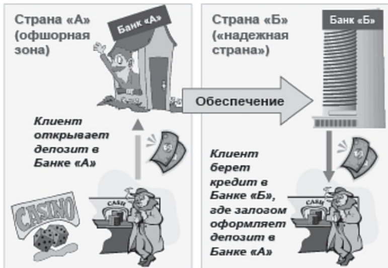
Рис. 1. Использование офшорного банка для обеспечения кредита

В соответствии с законодательством Люксембурга финансовые учреждения страны при установлении с клиентами деловых отношений обязаны идентифицировать их по официальному удостоверению личности и регистрировать. Необходимо идентифицировать и регистрировать не являющихся постоянными клиентов при совершении ими операций на сумму, превышающую установленный нормативными актами предел, а также проводить проверку, если в процессе деловых отношений возникают сомнения в личности клиента.