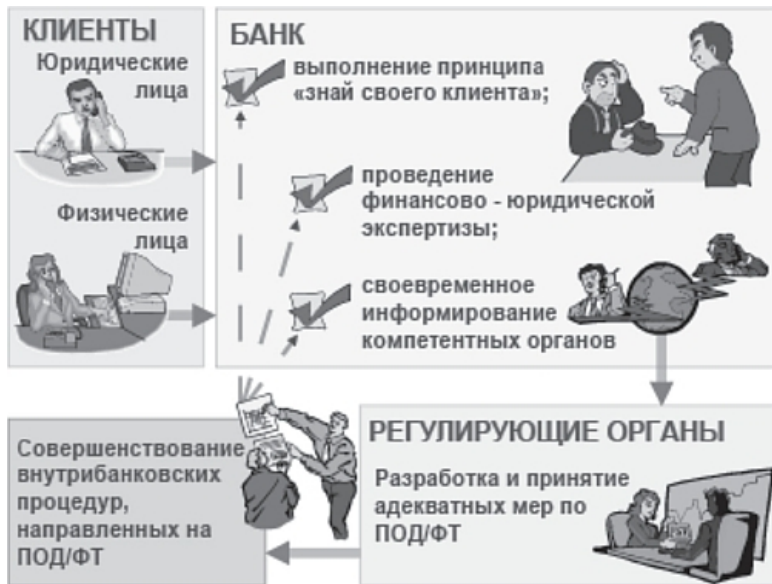
Рис. 9. Организация взаимодействия в рамках ПОД/ФТ

В настоящее время международные финансовые институты и банковское сообщество усиливают внимание к вопросам предотвращения использования национальных и мировой финансовых систем в целях отмыwania доходов, полученных преступным путем. Следствием этого стало не только создание в каждой стране национальных органов финансовой разведки и введение уголовной ответственности за участие в процессе отмыwania денег, но и разработка механизмов наднационального регулирования вопросов предот-