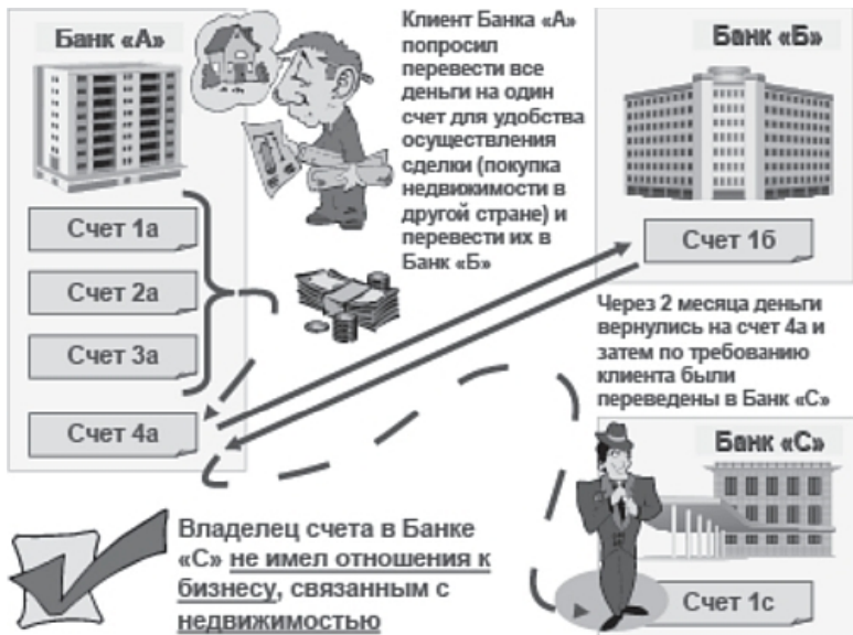
Рис. 5. Использование одних и тех же подтверждающих документов в схемах, направленных на ОД

Опасность террористической деятельности обусловлена наблюдаемыми тенденциями повышения уровня ее организованности, создания крупных террористических формирований с развитой инфраструктурой (в том числе выходящей за пределы одного государства).