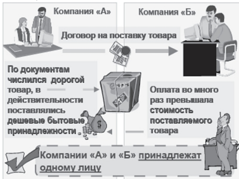
Рис. 7. Сделка, направленная на отмыwanie денег посредством умышленной подмены товара

показала, что сумма, заплаченная за этот товар, в несколько раз превышала стоимость поставляемого товара. После проведения расследования было установлено, что данная схема использовалась для легализации доходов, полученных преступным путем.