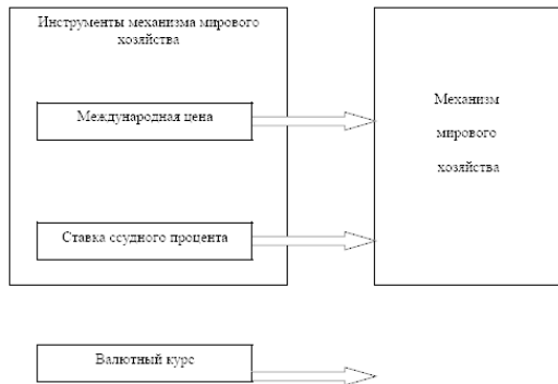
Рис. 3 Инструменты механизма мирового хозяйства

нах производственные филиалы, они расширяют возможности для экспорта своих товаров, преодоления таможенных барьеров, использования зарубежных рынков.