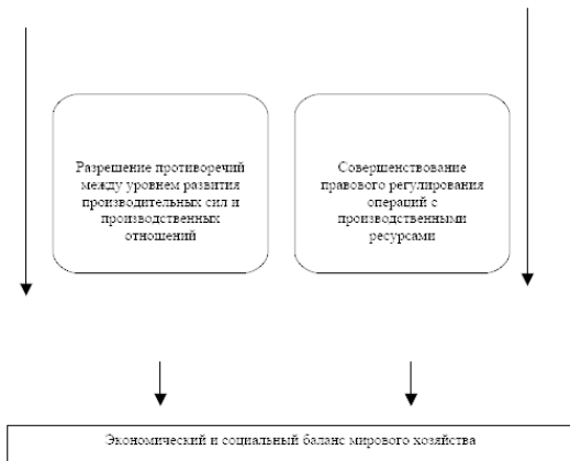
Рис. 2. Механизм регулирования мирового хозяйства средств производства является обязательным условием социально-экономического прогресса.

Механизм мирового хозяйства помогает решить центральную проблему современной экономики – определение и формирование потребности национальных экономик в средствах производства, предметов потребления и в услугах. Причем этот процесс является достаточно плавным и адаптивным к внешним воздействиям со стороны участников мирового хозяйства.