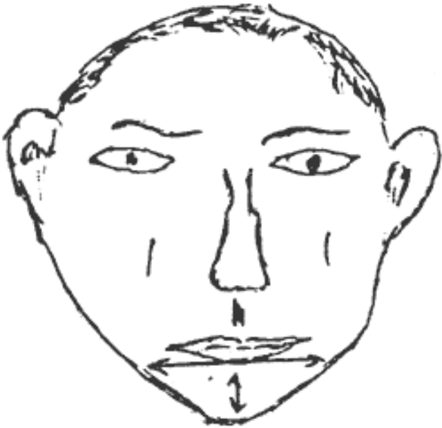
Рис.2.12. Узкая треугольная челюсть

Массивностью, безусловно, она не обладает. Но зато у нее есть свое достоинство: динамичность и концентрированность усилий в одной точке приложения. Где-то именно так действовали танковые клинья немецкого вермахта в первый