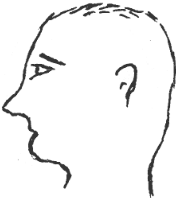
Рис.2.3. Нормальная нижняя челюсть в профиль

Самое главное: в крайние «позы» он становится очень редко, только когда другого варианта нет совершенно. Но большей частью пребывает в некой «поведенческой» гармонии. Можем смело предположить, что индивиду, действи-