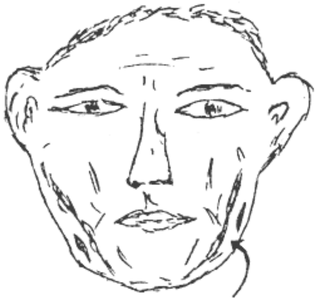
Рис.2.13. Волевые мышечные складки и желваки нижней челюсти

ФИЗИОГНОМИЧЕСКОЕ Н. В.: постарайтесь не спутать мышечные валики челюсти с обвислыми щеками! В