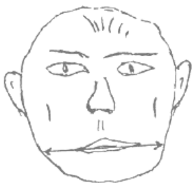
Рис.2.5. Широкая челюсть

«на износ» изматывать противника. Как ни странно, но широкая челюсть чувствительна. То есть, она создает предпосылки для мобильного реагирования на сигналы внешней среды, но не в атакующем, а больше в стабилизирующем или сохраняющем плане. Проще говоря, индивиды с широкой челюстью не нападают первыми. Зато они предостаточно держат удар. При условии, что длина челюсти не является маленькой. Иными словами, широкая челюсть не должна быть тонкой и легкой. То есть, мы опять же возвращаемся к результирующей схеме «ширина + длина». Но давайте все же закончим разговор о ширине, и скажем пару слов об узкой челюсти (см. схематические рисунки 2.5 и 2.6).