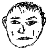
Рис.1.3. Промежуточный тип

ВИЗУАЛЬНЫЕ КРИТЕРИИ: если вы хотите быть профессиональным физиогномистом вам придется оценивать показатель длинно-, круглоголовости, что называется, на глаз. Поначалу будет немного затруднительно в пограничных случаях, но если постоянно и с интересом пересмотреть много лиц на фотографиях и в «живую», то необходимый практический навык, поверьте, приобретается. Ведь обычно начинающий специалист хочет чтобы «сразу и много». Так не бывает, разве, что в кино для наивных. Визуальная психодиагностика требует навыка. Можно сказать и более: «в себя впускание чужого образа, с последующей дешифровкой». Знаете, чем-то сродни системе Станиславского, когда надо пережить того, кого анализируешь. При этом по максимуму доверяйте своему «фоновому» впечатлению. Как говорится, никаких установок и ничего личного. Упаси Бог, подцепиться на изначально заготовленную схему. Простите за жесткость, но как психодиагност, в данном случае вы уже умерли. Потому совет: смотрите на лица людей в самых неожиданных