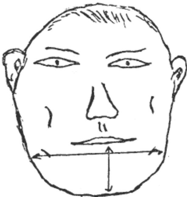
Рис.2.9. Челюсть широкая и удлиненная

Их невозмутимость как раз и обеспечивается крепкой челюстью и сильной нервной системой. Адаптируются к изменениям они медленно, поскольку легко выдерживают натиск воздействующего фактора. Собственно говоря, это же свой-