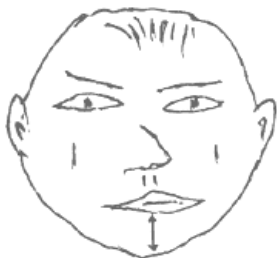
Рис.2.7. Удлиненная тяжелая челюсть