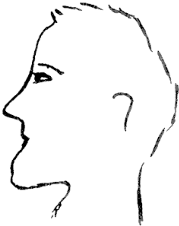
Рис. 2.1. Выдвинутая челюсть

РЕМАРКА: можем ли мы называть людей с выдвинутой