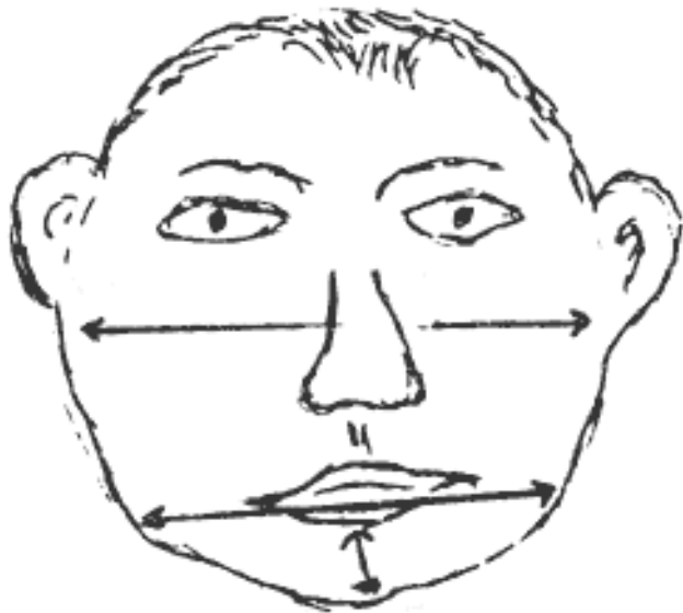
Рис.2.10. Челюсть широкая и короткая

есть легкая и мобильная с хорошей фланговой устойчивостью. Схематически она изображена на рис. 2.10.