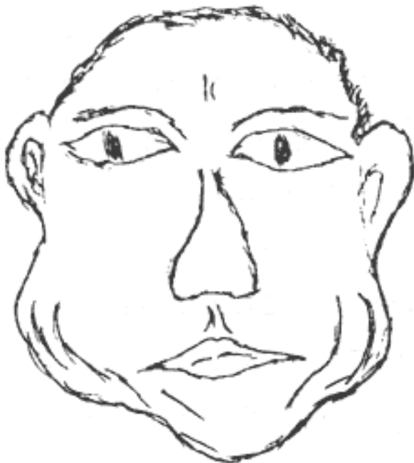
Рис.2.14. Щеки, обвисшие сильнее, чем челюстная мышца

Всматриваясь в портрет, или лицо вы обязательно сможете ощутить, есть ли в обвислых складках «мускульная энер-