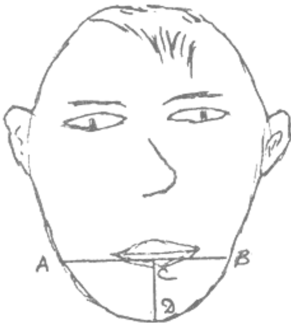
Рис.2.4. Определение ширины и длины челюсти

ДИАГНОСТИЧЕСКАЯ ФИЗИОМЕТРИКА. Как определить ширину челюсти? Проведите поперечную линию на уровне середины нижней губы, если губы толстые или от-