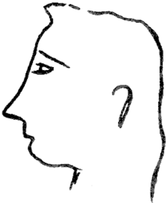
Рис.2.2. Втянутая челюсть

Ситуационный случай понятен: необходимое отступление, переход в глухую защиту. Если данный физиогномиче-