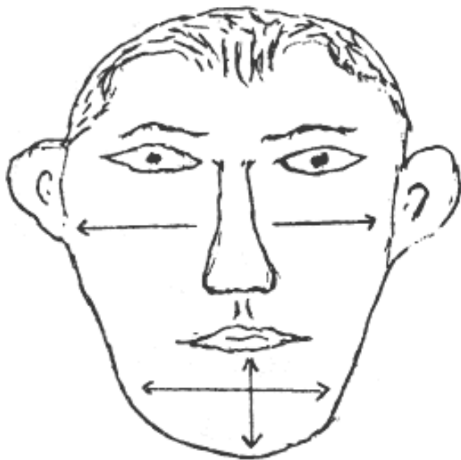
Рис.2.11. Челюсть узкая и удлиненная

есть узкая и тяжелая. Внешне напоминает выступающий к доле внушительный челюстной «мыс» (см. рис. 2.11).