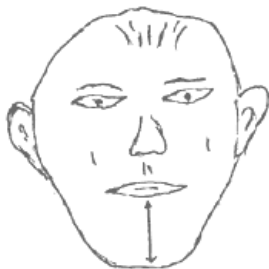
Рис.2.8. Короткая легкая челюсть

Тяжелая или длинная челюсть, наоборот, визуальнo убеждает своей основательностью и методичностью в делах и подходах. Такие люди, чаще всего, работают методом «продавливания» проблемы. Своего рода, «принцип лома», есть такое ручное приспособление, каким любители подледного лова долбят лунку. Впрочем, ассоциация на тему, если челюсть явно удлиненная и одновременно узкая. Но в целом, удлиненность ударной кости создает предпосылки для упорства, целеустремленности и крепости. То есть, если проблема не продавливается, то ее надо раскалывать. «Тяжелая» челюсть обуславливает генетическое свойство выдерживать сильный, но кратковременный стресс. Если индивид успевает повернуться к нему лицом. Не столько фигурально, сколько психологически.