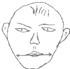
Рис.2.6. Узкая челюсть

Узкая челюсть, безусловно, более уязвима для бокового смещения. Другими словами, флангового удара. Прочную оборону она держать никак не в состоянии. Поэтому человек с узкой челюстью всегда предпочитает резко поворачивать-