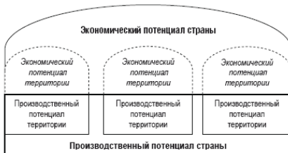
Рис. 1.2. Место производственного потенциала территории в экономическом потенциале страны

В науке существует определенная иерархия потенциалов, высшим из которых является экономический потенциал, включающий в себя ряд структурных элементов. В рамках данного исследования будет рассмотрен один из таких элементов экономического потенциала – производственный потенциал.