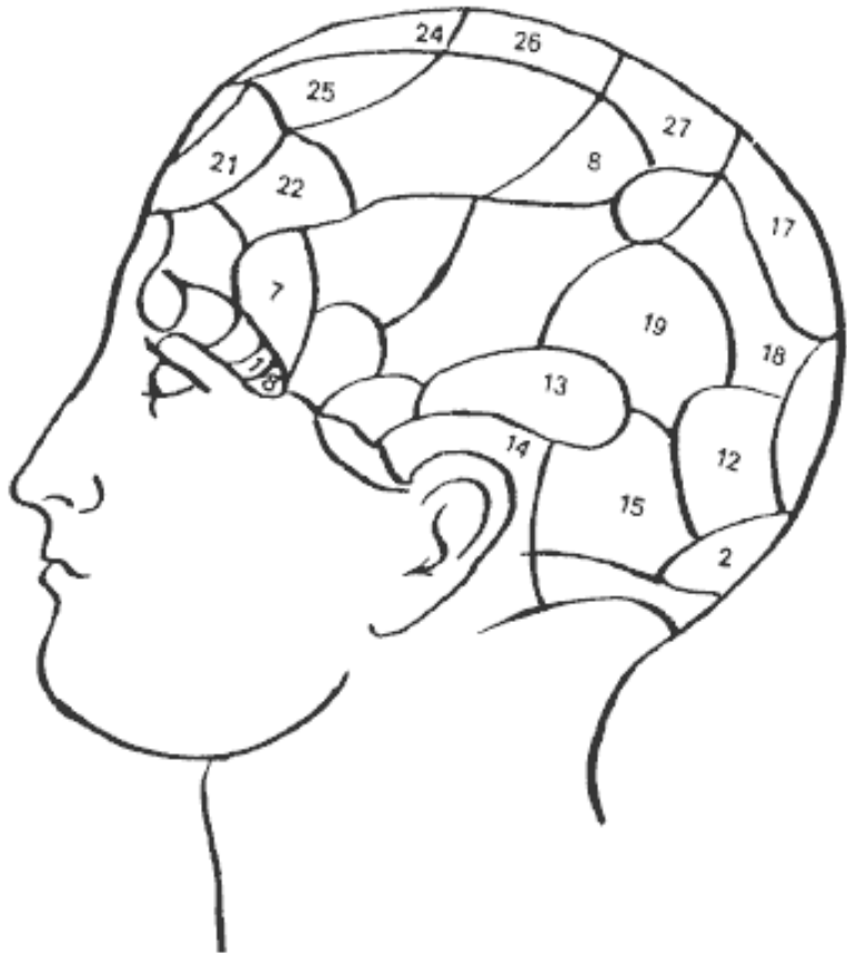
Френологические карты Галля

Слава Галля была недолгой. Уже в XIX веке его система была убедительно опровергнута. Френология давно счита-