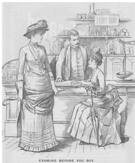
Рис. 1.1. «Перед покупкой внимательно изучите». Century Magazine , 1886.

читательным звеном цепочки распределения суммарной прибыли и не смогла урезать доходы ритейлера и посредника. Несмотря на увеличение финансовых вложений в рекламу для потребителей, достигшую в 1886 г. $146 тыс., Харли Проктер отмечал, что «спрос на мыло высокий, но цены низкие и доходы тоже» 6 .